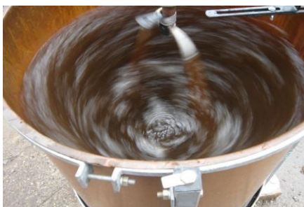
Dynamiseur (sources : http://www.camille-braun.com )