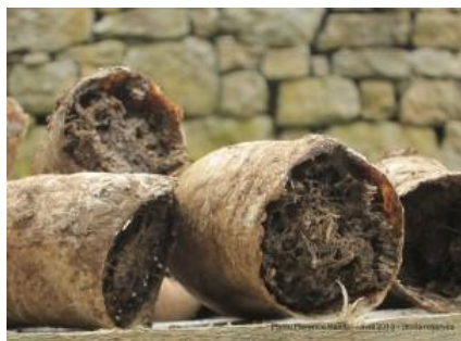
Bouse de corne 500 (source: http://www.verre2terre.fr )

conseillermaraichage13-84@bio-provence.org