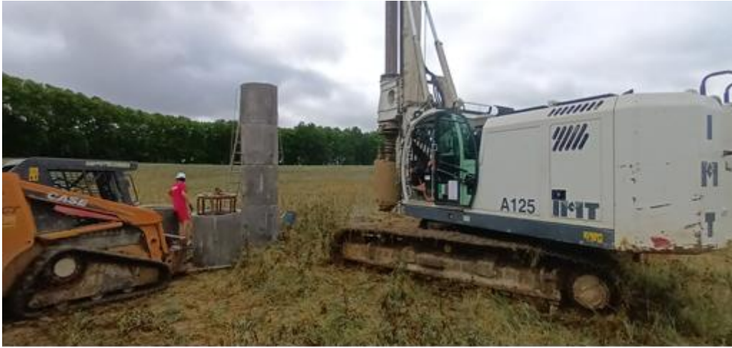
Figure 2 : Aménagement du puit sur la parcelle de Grande Borde.

Une analyse agronomique a été réalisée lors de l'étude de faisabilité. En voici une synthèse :