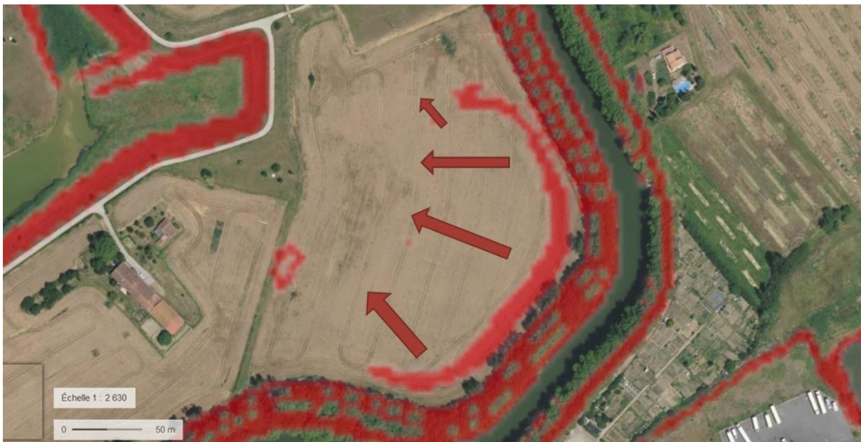
Figure 3 : Topographie de la parcelle.